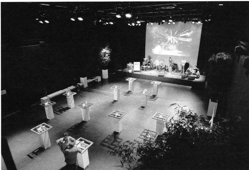
Theaterzaal Hal 4

In de loop der jaren begon Hal 4 begon zich steeds meer op jongeren en jongerencultuur te richten. In 1998 konden jongeren er leren wat ze op de computer konden doen met video, fotografie, geluid en internet. Deze workshops kregen de toepasselijke naam Digital Playground , en groeiden uit van klein evenement naar een geoliede organisatie met een eigen locatie in Rotterdam en diverse projecten in binnen- en buitenland. De Digital