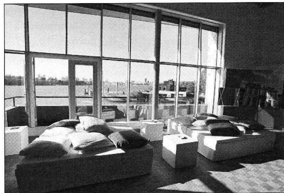
Foyer Hal 4

Playground intensief begeleid door studerende of pas afgestudeerde grafisch ontwerpers, kunstenaars, fotografen en webdesigners. Door hun leeftijd hebben deze workshopleiders goede feeling met de heersende trends in de jongerencultuur en staan daarmee dicht bij de leefwereld van de doelgroep. Zij stimuleren de jongeren zelf oplossingen te vinden en hun eigen creativiteit te gebruiken. De benadering van learning-by-doing gaat ervan uit dat jongeren snel leren wanneer zij op een actieve manier les krijgen. Deelnemers gaan dan ook direct zelf aan de slag en gebruiken hun eigen creativiteit. Zij leren door te doen en door te ervaren, niet door passief te luisteren en toe te kijken. Inmiddels is gebleken dat ze daardoor sneller en intensiever leren. Docenten staan tijdens de workshops vaak met verbazing te kijken naar de toewijding en concentratie waarmee de leerlingen werken.