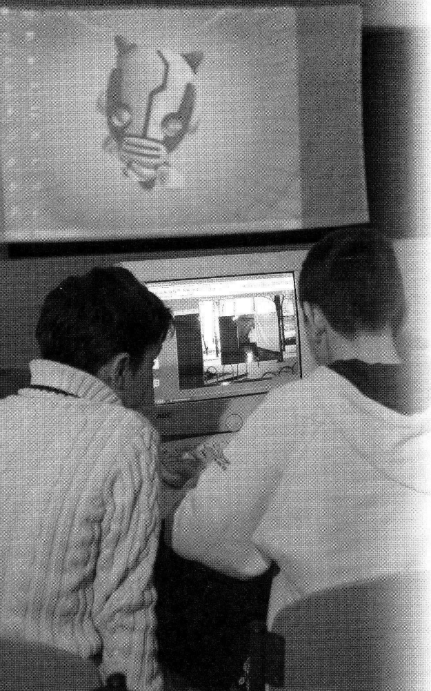
Digital Playground