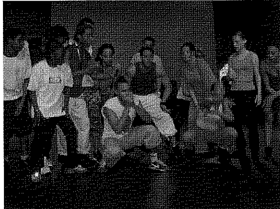
Spelers van Lef en YEA bij de repetitie van Seven Sins